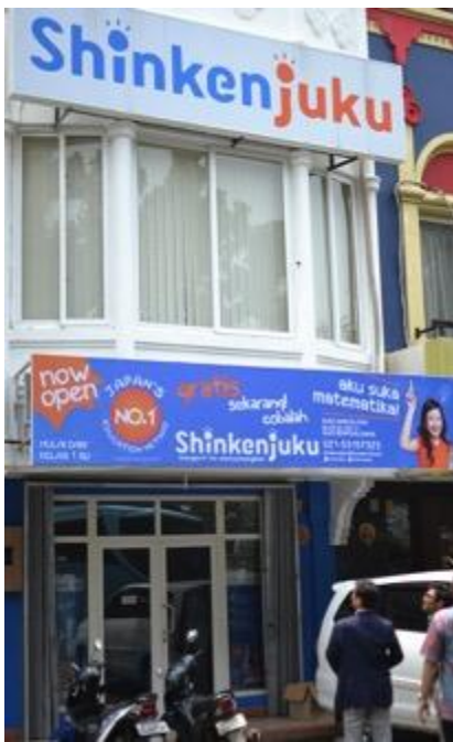
Outlet pertama di BSD

Biasanya membutuhkan waktu 1 tahun untuk mencapai jumlah 100 siswa, Tapi kami sudah mencapai 100 siswa hanya 6 bulan!!