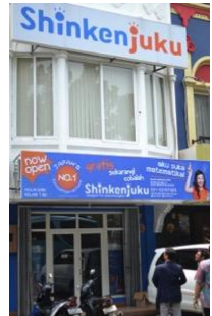
Outlet pertama kami di BSD

Silahkan kunjungi website http://www.benesse-hd.co.jp/en/